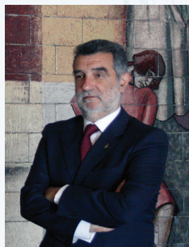
Carlos Pina Presidente do Conselho Diretivo do LNEC

A primeira jornada deste ciclo, intitulada “Recursos naturais e Energia”, abordará as temáticas da sustentabilidade dos recursos naturais, da gestão do risco e emergência em obras e sistemas naturais, das energias renováveis, da segurança e comportamento de barragens e obras marítimas, e da instrumentação, metrologia e TIC no aproveitamento de recursos naturais.